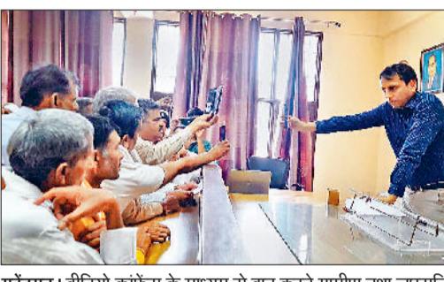
महेन्द्रगढ़। वीडियो कॉफ्रेंस के माध्यम से बात करते ग्रामीण तथा लघुसचिवालय में उपस्थित ग्रामीण।

जिला उपायुक्त ने वीडियो कॉफ्रेंस पर ग्रामीणों को दिया जल्द मांग पूरी करने का आश्वासन, अप्रैल में उन्हाणी गांव के पास हुआ था हादसा