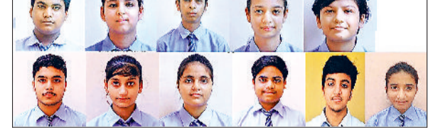
नारनौल। डीपीवी स्कूल के विद्यार्थी।