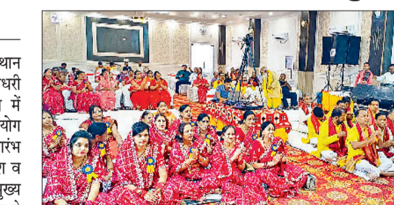
नारनौल। श्रीमद्भागवत कथा सुनती महिलाएं।