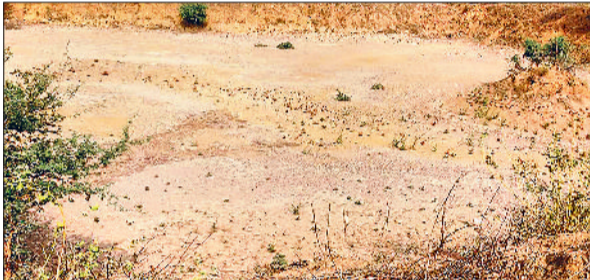
महेंद्रगढ़। गांव दुलोत अहीर में सूखा पड़ा जोहड़ और गांव पालड़ी पनहार में सूखा पड़ा जोहड़।

सिंचाई विभाग के अधिकारियों की ओर से कागजों में महेंद्रगढ़ डिवीजन के 80 प्रतिशत गांवों के जोहड़ में पानी पहुंचाया जा चुका है, लेकिन हकीकत में इन गांवों में से कई गांव के जोहड़ ऐसे जिनमें एक बूंद पानी तक नहीं पहुंचा है। विभाग के अधिकारी सरकार को गलत रिपोर्ट देकर गुमराह कर रहे हैं। विभिन्न गांवों के सरपंच मुख्यांशु को शिकायत भेजकर विभाग के अधिकारियों के खिलाफ कार्रवाई की भी मांग कर चुके हैं। बाता दे कि अटल भूजल योजना केंद्र सरकार द्वारा संचालित एक महत्वाकांक्षी योजना है। इसका मुख्य उद्देश्य गिरते भूजल की समस्या को दूर कर भू-जल स्तर को बढ़ाना है। इस योजना में जिला महेंद्रगढ़ को भी शामिल किया गया था। इस योजना के तहत वर्ष दो बार गांव के जोहड़ों में नहरी पानी