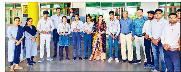
नारनौल। यदुवंशी स्कूल थनवास के विद्यार्थी व स्टाफ सदस्य।