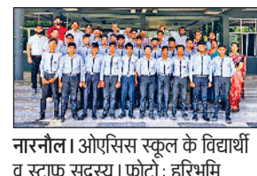
नारनौल। ओएसिस स्कूल के विद्यार्थी व स्टाफ सदस्य।