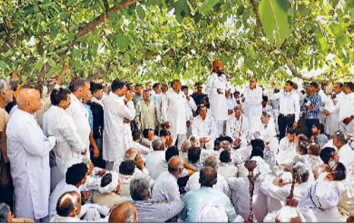
महेन्द्रगढ़