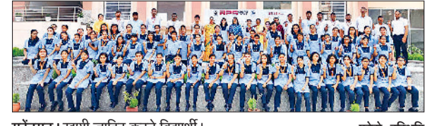
महेन्द्रगढ़। खुशी जाहिर करते विद्यार्थी।